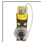
Fondina da cintura