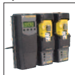
Compatibile con MicroDock II