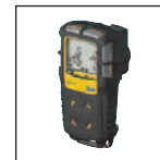
Guscio di protezione antiurto

Per un elenco completo degli accessori contattare BW Technologies by Honeywell.